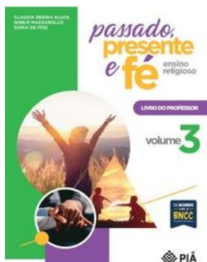
ENSINO RELIGIOSO – ED. POSITIVO