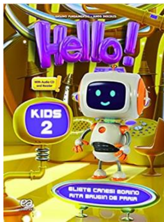
LÍNGUA INGLESA – ÁTICA