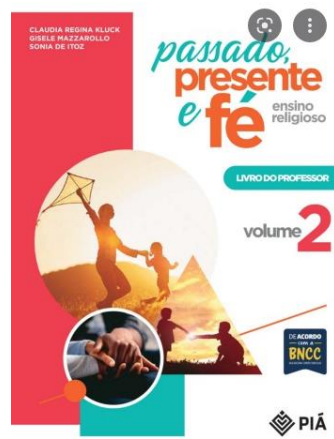
ENSINO RELIGIOSO – POSITIVO